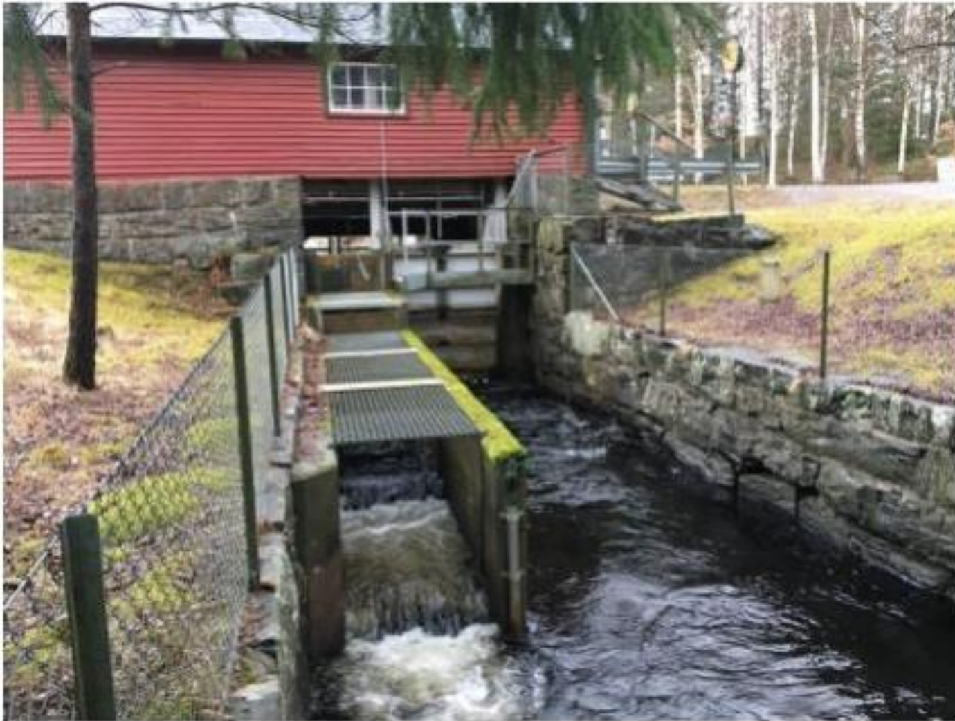
Figur 2. Befintlig fiskväg vid Nedsjö dämme. Vy från utloppet i riktning uppströms mot nordost.