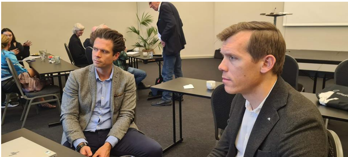
Bilder från symposiet i Tanumstrand i oktober.